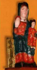
Statue de la Vierge du château. Statue romane.

11ème siècle. Les reliques se trouvaient à l'origine dans la crypte du château.